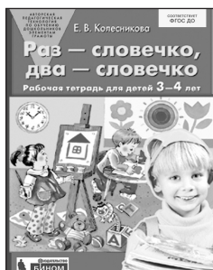
«Раз – словечко, два – словечко». Рабочая тетрадь для детей 3–4 лет